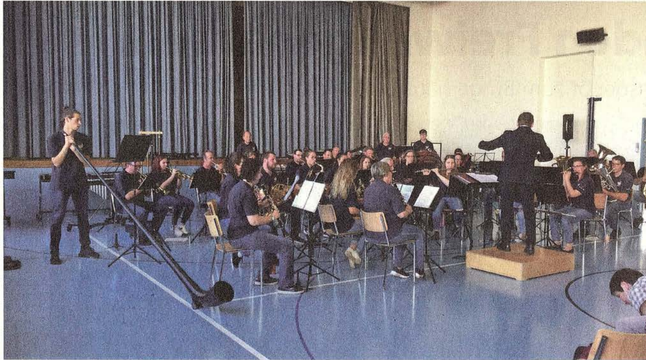
Pepe Lienhards «Swiss Lady» wird inklusive Alphornsolo geboten.

Die Stühle in der Primarturnhalle waren am späten Samstagnachmittag alle besetzt und einige Leute genossen das Programm stehend. Geplant wäre ein Open-Air-Konzert auf dem Schulhausplatz gewesen. Aufgrund des Regens am Nachmittag beschloss der Musikverein aber, in die Halle zu zügeln. Der Stimmung tat dies keinen Abbruch. Hits wie «Swiss